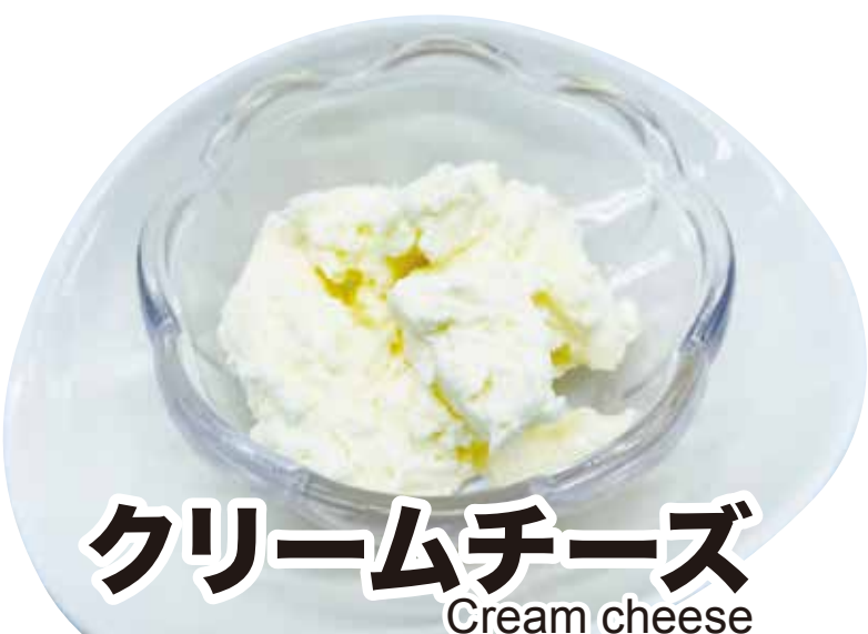
クリームチーズ Cream cheese 346円 (税込380円)