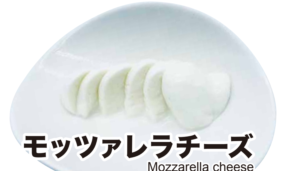
モッツァレラチーズ Mozzarella cheese 346円 (税込380円)