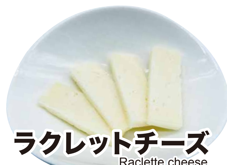
ラクレットチーズ Raclette cheese 346円 (税込380円)