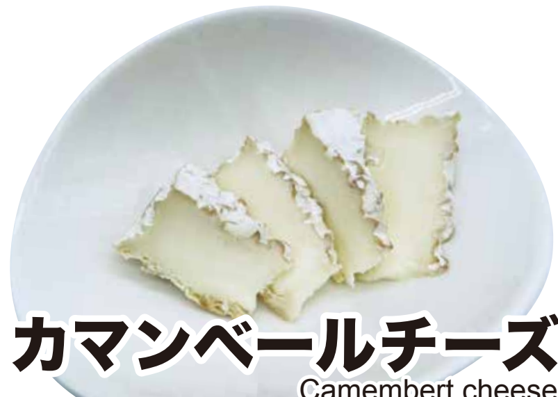
カマンベールチーズ Camembert cheese 346円 (税込380円)