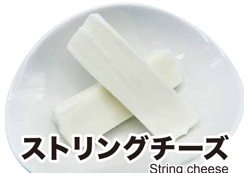
ストリングチーズ String cheese 346円 (税込380円)