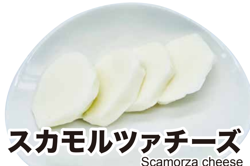
スカモルツァチーズ Scamorza cheese 346円 (税込380円)