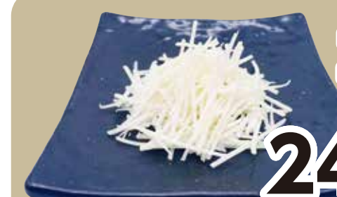
ゴードチーズ Gouda cheese 246円 (税込270円)