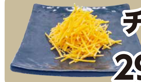
チェダーチーズ Cheddar cheese 291円 (税込320円)