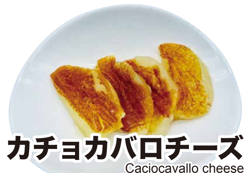
カチョカバロチーズ Caciocavallo cheese 346円 (税込380円)